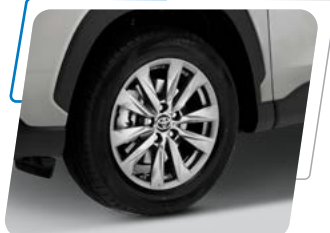
Aros de aleación de 18"