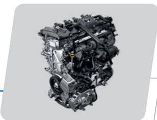
Tecnología híbrida auto-recargable: Potencia combinada de 120.7 HP