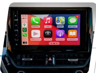
Radio táctil de 9" con función AM/FM, USB, Bluetooth, Android Auto y Apple CarPlay®