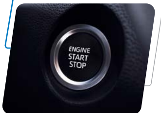
Encendido por botón