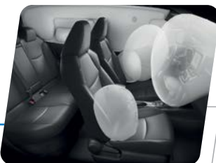
7 bolsas de aire SRS para mayor seguridad